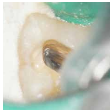
プレジジョン Endo Bur を用いて、根管口部に覆い被さっている象牙質を削合している。