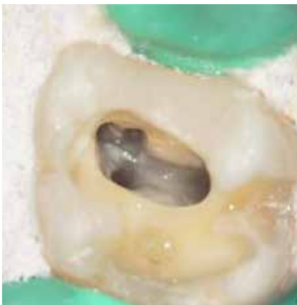
根管形成終了後の根管口部