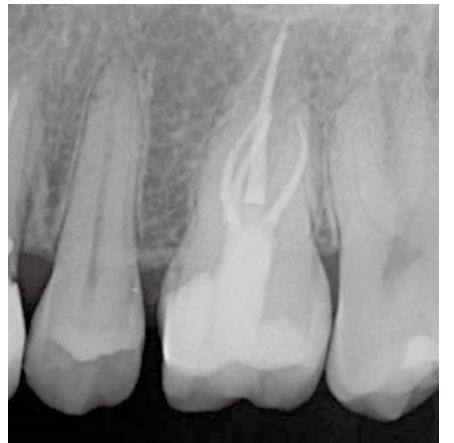
根管充填後のレントゲン写真