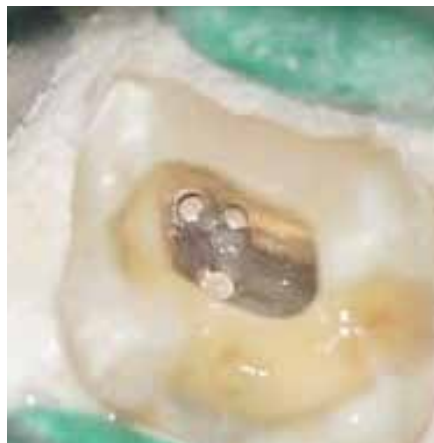
根管充填後の根管口部