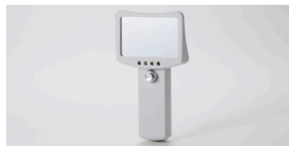
口元から離して見る

「ブライト」を各チェアに1台ずつ置いて頂くと、患者様とのコミュニケーションや治療説明の際にお役立て頂けます。