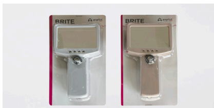
自費治療後のプレゼント

先生を待っている間にも、手に取って自由に口腔内を見られる環境作り。 意識の高い患者様は興味深く、お口の中を見えています。