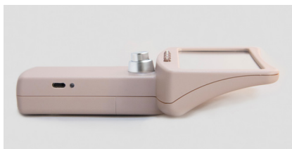
各チェアサイドにも

先生を待っている間にも、手に取って自由に口腔内を見られる環境作り。 意識の高い患者様は興味深く、お口の中を見えています。